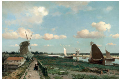
Jan Hendrik Weissenbruch, 1870, De Trekvlucht

De zeelucht van Scheveningen, het ruisen van de duinen, de weidse polders – de schilders van de Haagse School vingen deze sferen meesterlijk op hun doeken. Onze museummedewerker brengt de wereld van Mesdag, Mauve en andere Haagse meesters dichterbij met reproducties van iconische werken. In de koffer uit het Kunstmuseum zitten ook objecten die rechtstreeks uit de schilderijen lijken te komen. Deze mogen aangeraakt worden en brengen zo de geschiedenis tot leven.